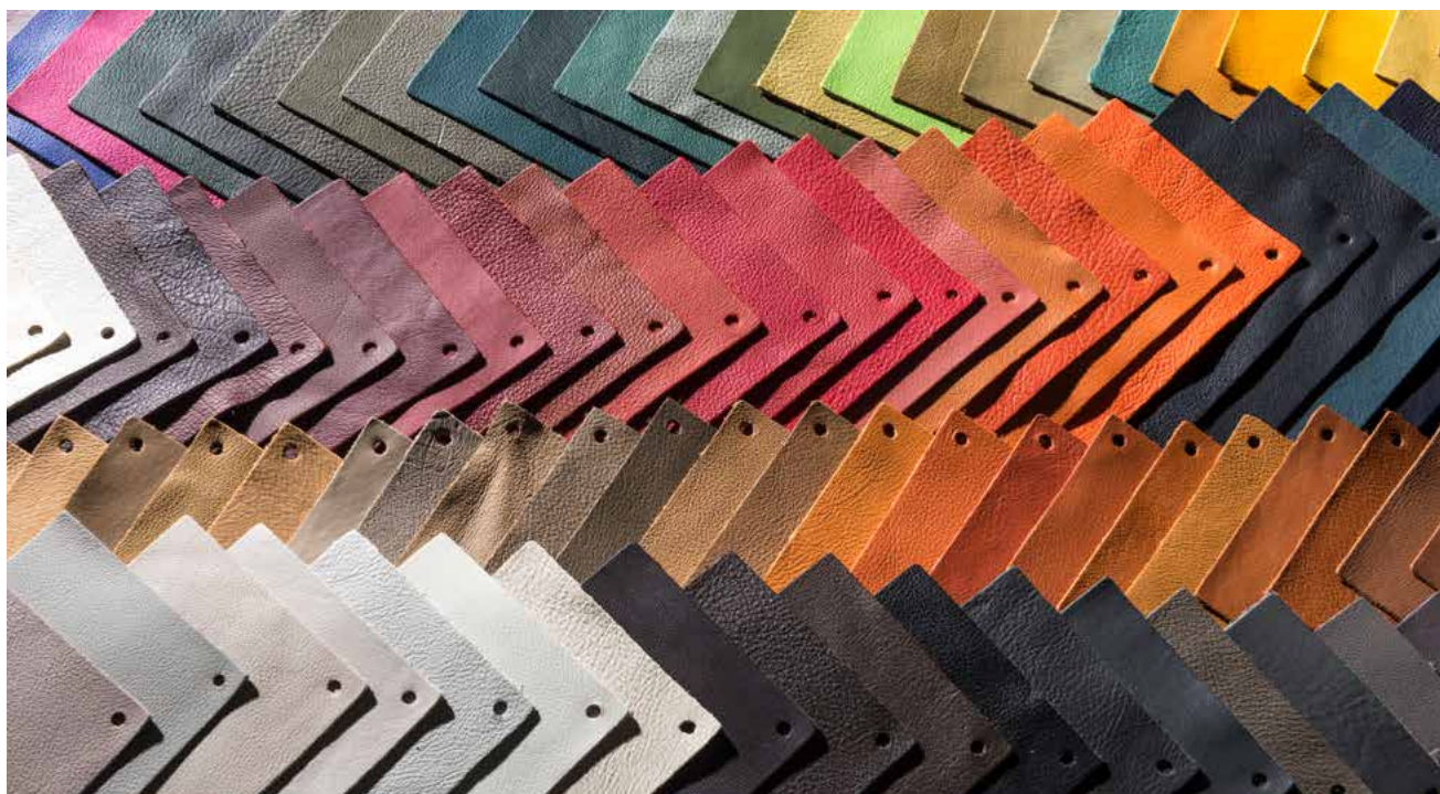
OPTION BEI CENTURION IVECO DAILY UND MERCEDES BENZ ATEGO