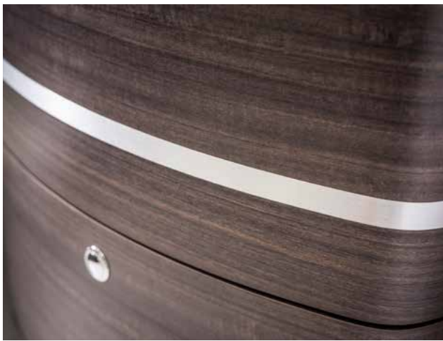
MÖBELBAU IN ATLAS ZEDER MIT EINGELASSENEN EDELSTAHLNISSEN AUF DEN MÖBELFRONTEN

Ein großartiges Raumerlebnis. Die Möbellinie Rotondo in „Atlas-Zeder“ mit eingelassenen Edelstahllisenen besticht durch ihre betont emotionale Formsprache. Flächen aus hochwertigem Mineralstoff in „Carrara Bianco“ in der Küche sowie „Onyx Bianco“ im Bad überzeugen mit seidig-matter Optik. Der abriebfeste Boden „Amtico“ im Yachtstyle mit seinen silbernen Fugen sorgt für hervorragenden Laufkomfort und spiegelt die Edelstahleinlagen des Möbelbaus wieder.