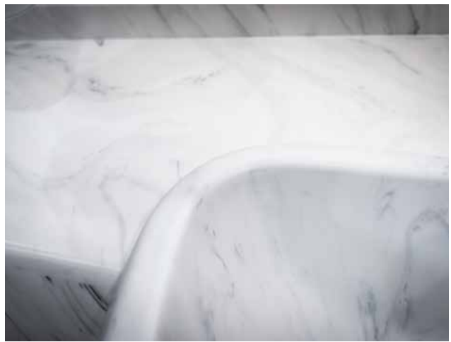
MINERALSTOFF ONYX BIANCO IM BAD (CENTURION ACTROS)