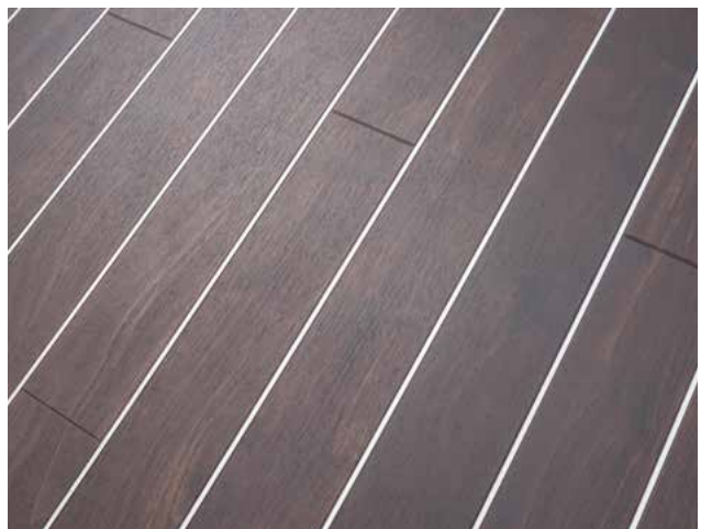
DESIGNBODEN IM YACHTSTYLE